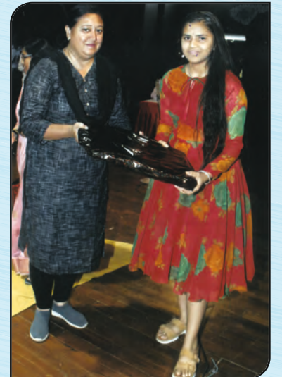
શૈક્ષણિક ઇનામ વિતરણ સમારોહમાં તેજસ્વી વિદ્યાર્થીનીને ભેટ અર્પણ કરતા દર્શનાબહેન જોષી