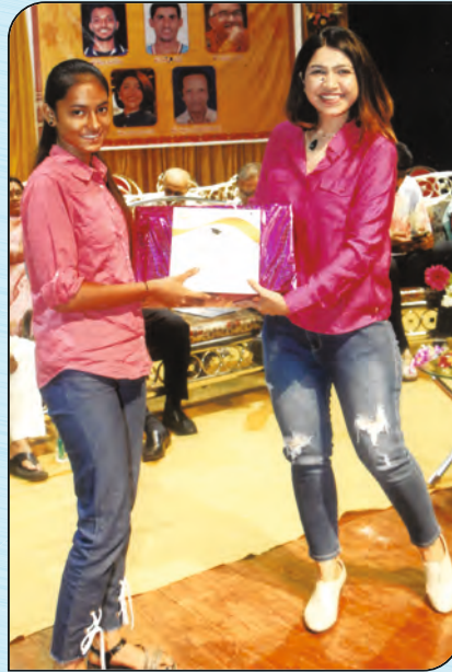
સન્માનિત મેઘા ઠક્કર ભટનાગરના હસ્તે વિદ્યાર્થીનીને ભેટ અર્પણ કરાઈ