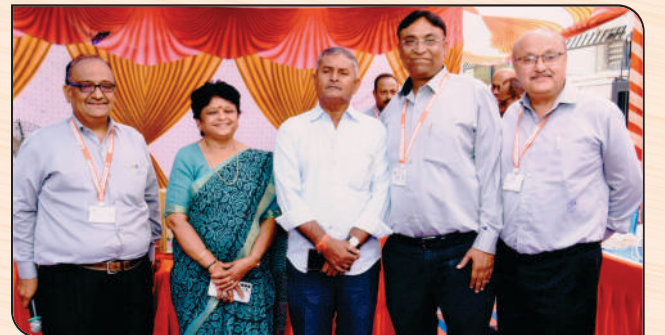
ભાવનગર મહાનગરપાલિકાનાં મેયરશ્રી, ડેપુટી મેયરશ્રી તથા બેંકના અધિકારીશ્રીઓ