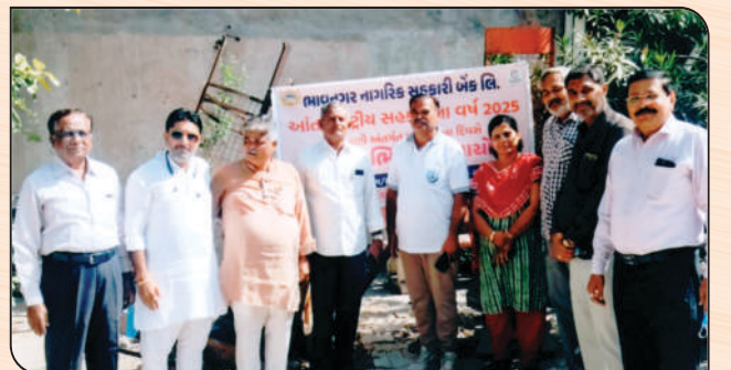
સહકારીતા વર્ષ-૨૦૨૫ ના ઉજવણીના ભાગરૂપે સ્વચ્છતા અભિયાનમાં ઉપસ્થિત મેયરશ્રી તથા બેંકના ચેરમેનશ્રી, વાઈસ ચેરમેનશ્રી તથા બેંકના ડીરેક્ટરશ્રીઓ