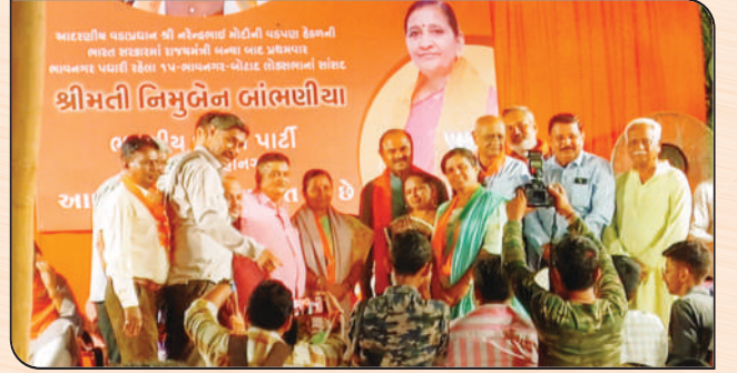
નવનિયુક્ત કેન્દ્રીય મંત્રી શ્રીમતી નીમુબેન બાંભણીયાનું અભિવાદન કરતા બેંકના બોર્ડ ઓફ ડીરેક્ટરશ્રીઓ