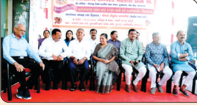
સરદારનગર (કાળીયાબીડ) શાખાના ઉદ્ઘાટન પ્રસંગે ઉપસ્થિત મહાનુભાવો