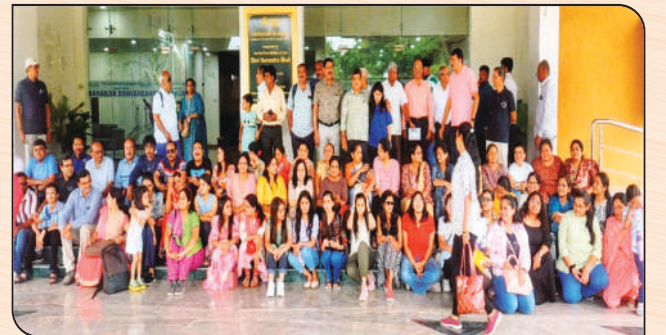
સ્ટેચ્યુ ઓફ યુનીટી ખાતે બેંકનાં ડિરેક્ટરશ્રીઓ તથા સ્ટાફ તેઓના પરિવાર સાથે પ્રવાસે જતા