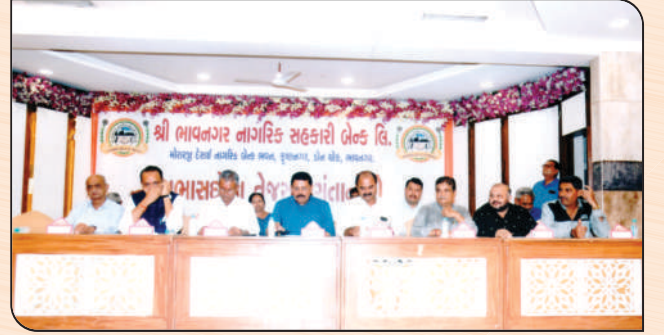
સભાસદોના તેજસ્વી સંતાનોના સન્માન સમારોહમાં ઉપસ્થિત મહેમાનશ્રીઓ અને ડિરેક્ટરશ્રીઓ