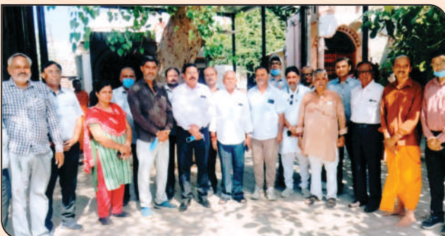
સહકારીતા વર્ષ - ૨૦૨૫ ના ઉજવણીના ભાગરૂપે વૈજનાથ મંદિરમાં સ્વચ્છતા અભિયાનમાં ઉપસ્થિત મેયરશ્રી બેંકના બોર્ડ ઓફ ડીરેક્ટરશ્રીઓ તથા કર્મચારીશ્રીઓ