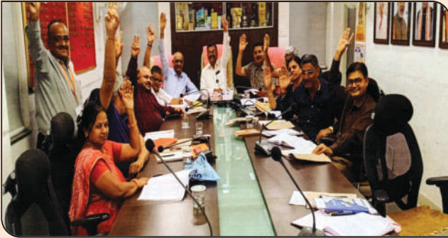
વન નેશન-વન ઇલેક્શનને સમર્થન આપતા બેંકના બોર્ડ ઓફ ડીરેક્ટર્સશ્રીઓ તથા અધિકારીશ્રીઓ