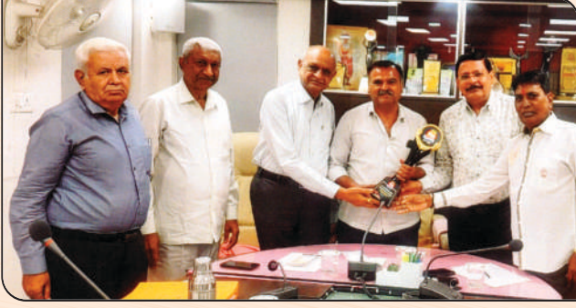
બેંકને મળેલ પ્રતિષ્ઠિત “બેંકો” એવોર્ડ સ્વીકારતા બેંકના બોર્ડના પદાધિકારીશ્રીઓ તથા ડીરેક્ટરશ્રીઓ