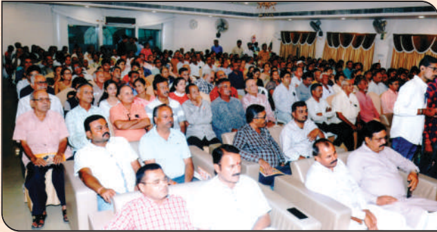
સભાસદોના તેજસ્વી સંતાનોના સન્માન સમારોહમાં ઉપસ્થિત સભાસદો અને આમંત્રિત મહેમાનો